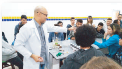
Laboratório de Química