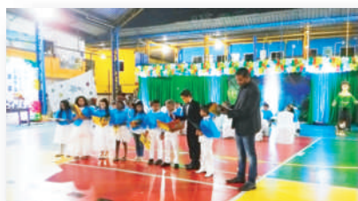
Doutores do ABC

Educação cidadã e resiliente é um convite ao auto conhecimento, estimulando a empatia e a afetividade.