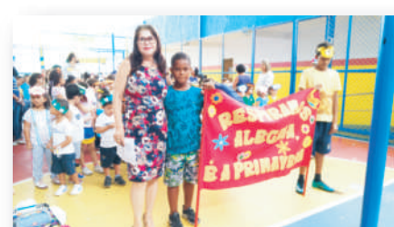
Homenagem à Primavera

Obs. Este informativo é o espaço de notícias das atividades do Colégio Acadêmico, nas unidades de Vilas, Pituba e Feira, no período de julho à dezembro de 2019.