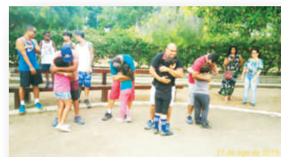
Homenagem aos Pais