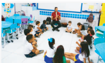
Aulas de Música