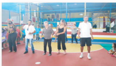
Dia dos Avós