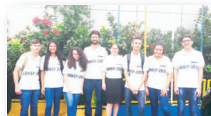
Olimpíadas do Conhecimento